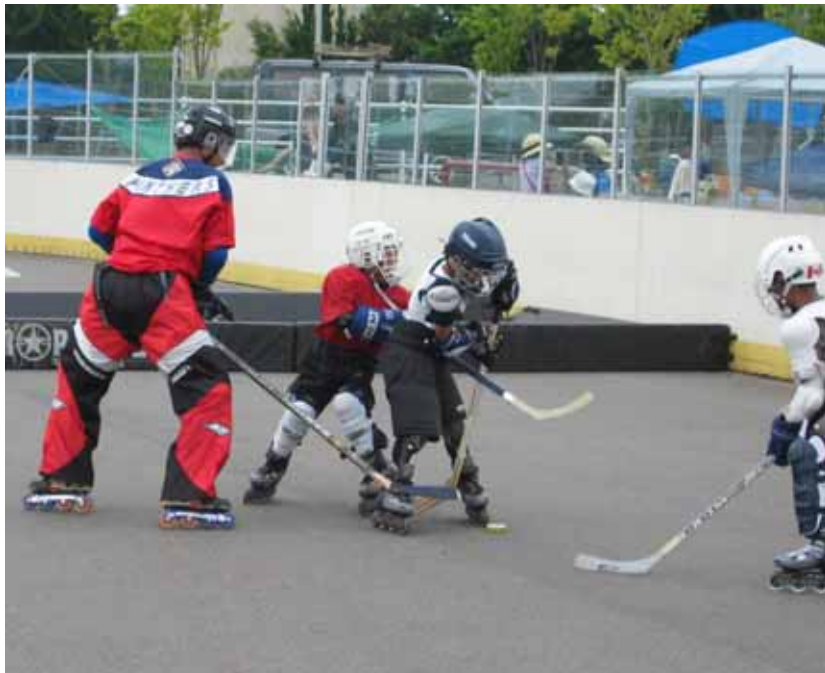
下位リーグ第1回戦 (はやと vs お～ちゃんず)より